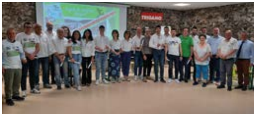
Corso di formazione tecnica in fabbrica - Giugno 2022

Un Ringraziamento a tutte le donne e uomini che hanno collaborato alle manifestazioni precedenti e alla realizzazione di questa 4a edizione ed in particolare a: